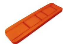
7014/A Materasso 4 pz. in Skay ignifugo elettrosaldato