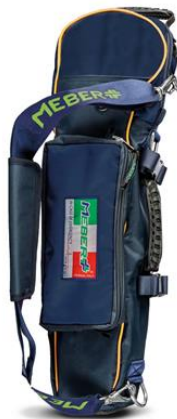
12072/BG "COVER OX 5 BG"- Portabombola professionale per bombole da lt 5