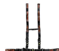
612/N-2/MEB Cintura toracica regolabile nera con aggancio a 4 punti e nastro MeBer per barelle autocaricanti e