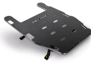
12080 "MBP" pianale bariatrico largo per barelle autocaricanti FROG MERCURY e GECKO completo di cinture con arrotolatore e fissaggi barella