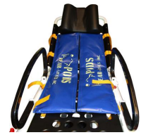
12154 Sistema di contenimento Bear Pods per obesi per barelle autocaricanti