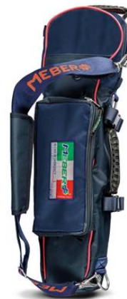
12072/BR "COVER OX 5 BR"- Portabombola professionale per bombole da lt 5