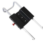
12128 Sistema allungabile per poggiatesta barella MeberX e Mercury