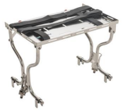
939 Piano portastrumenti per barelle