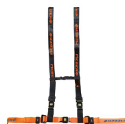
612/AN-2/MEB Cintura toracica regolabile arancio/nera con aggancio a 4 punti e nastro MeBer per barelle